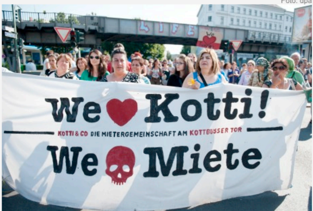
Demonstranten protestieren Anfang August am Kottbusser Tor in Kreuzberg gegen hohe Mieten. Eine neue Untersuchung zeigt, dass die durchschnittlichen Mieten auch im laufenden Jahr erneut gestiegen sind